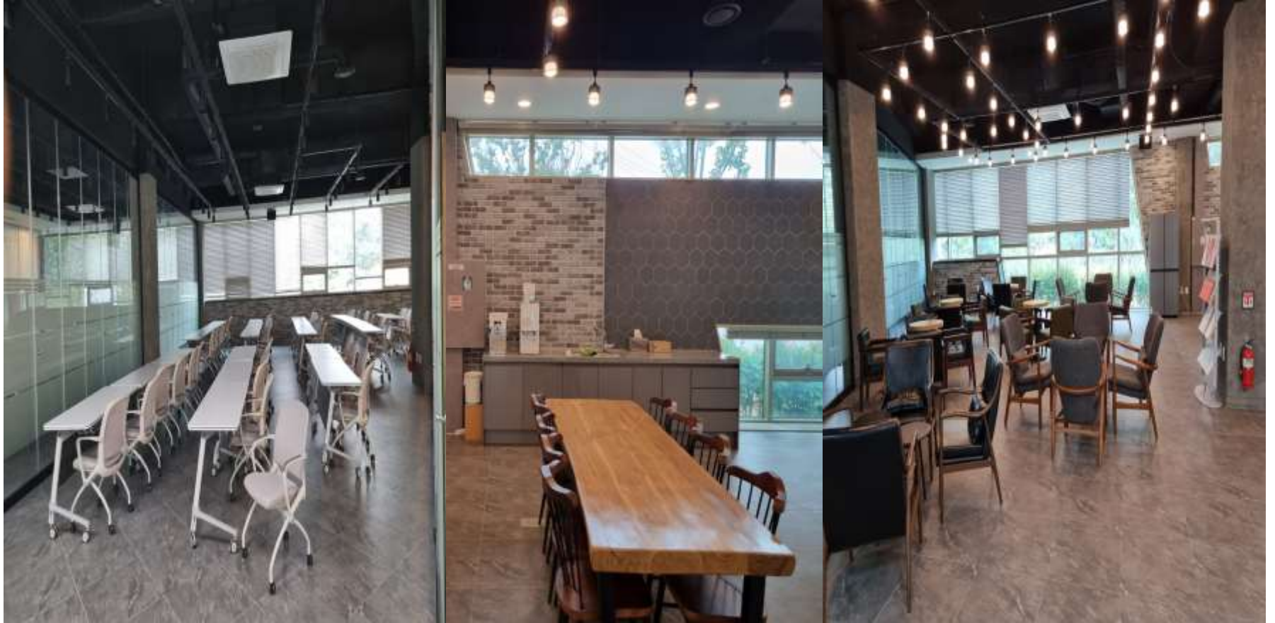
휴게실 및 복지 공간