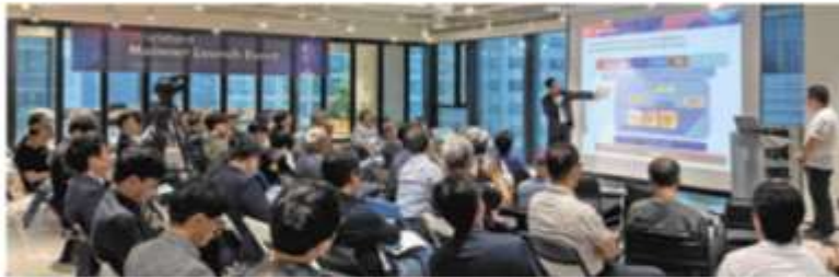
블록체인·AI 융합연구를 소개하는 강연 모습. (가운데) AI 융합 연구센터가 설립된 모습. (오른쪽) AI 융합 연구센터가 설립된 모습.

인공지능(AI)을 접목한 연구 개발 플랫폼인 AI Lab을 설립하고 있는 기업, 새로운 산업융합 기업인 AI 융합 기업은 AI 융합 기업으로 성장하고 있다. AI 융합 기업은 AI 기술을 접목한 연구 개발 플랫폼인 AI Lab을 설립하고 있는 기업, 새로운 산업융합 기업인 AI 융합 기업은 AI 융합 기업으로 성장하고 있다. AI 융합 기업은 AI 기술을 접목한 연구 개발 플랫폼인 AI Lab을 설립하고 있는 기업, 새로운 산업융합 기업인 AI 융합 기업은 AI 융합 기업으로 성장하고 있다.