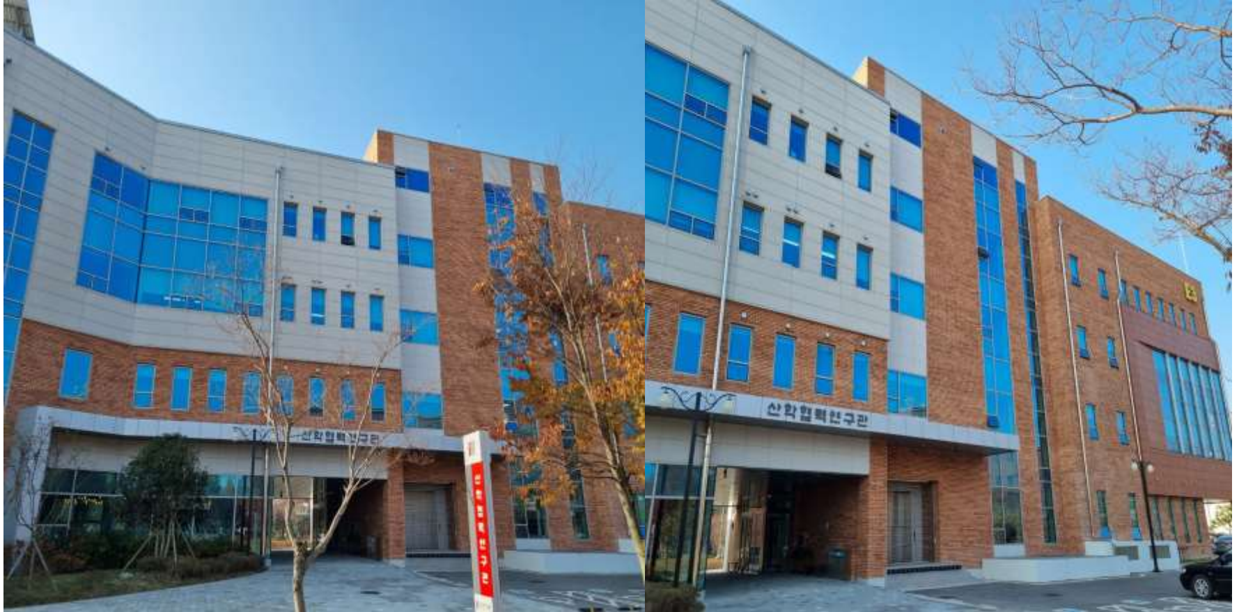
리버밴스 주식회사 입주 건물 전경 사진(광주)